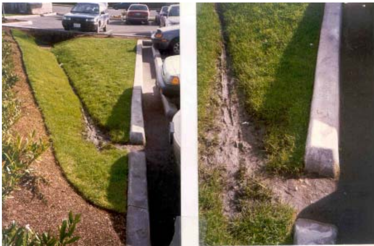
Seattle i April 1997