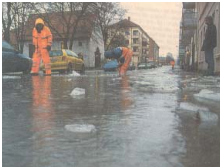
Figur 5.3 Klæbuveien Trondheim 5. februar 1999 (Foto: Ivar Mølsknes. Adresseavisen 5.2.1999)

Regn-på-snø hendelser gir ofte oversvømmelser og store overløpsutslipp. Overvannets skaper jevnlig stressede driftssituasjoner om vinteren, der avløpssystemene, både primær- og sekundærsystemet overbelastes og oversvømmelser oppstår som i Klæbuveien i Trondheim 5. februar 1999. Da rant overvannet (regn og smeltevann) ned fra Høgskoleplatået og ned i Klæbuveien og inn i kjellerne. Overvannet fant ikke vegen ut av området på overflate. Det ikke var planlagte flomveger ut av området. I boligblokken på bildet stod vannet i kjelleren en meter opp på veggen. I ledningsnettlet ble overvannet blandet med spillvannet så en blanding av kloakkvann og overvann befant seg i kjelleren. Skadegivende flomsituasjoner oppsto også 31. januar og 15. februar, 1999 (Thorolfsson og Matheussen 2001)