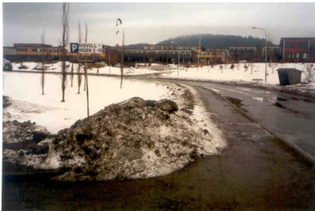
Figur 5.4 Forurensinger i urban snø i Risvollanfeltet i Trondheim

Bildet viser forurensinger i urban snø i Risvollanfeltet i Trondheim.